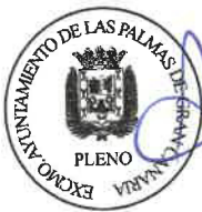
Carolina Darias San Sebastián