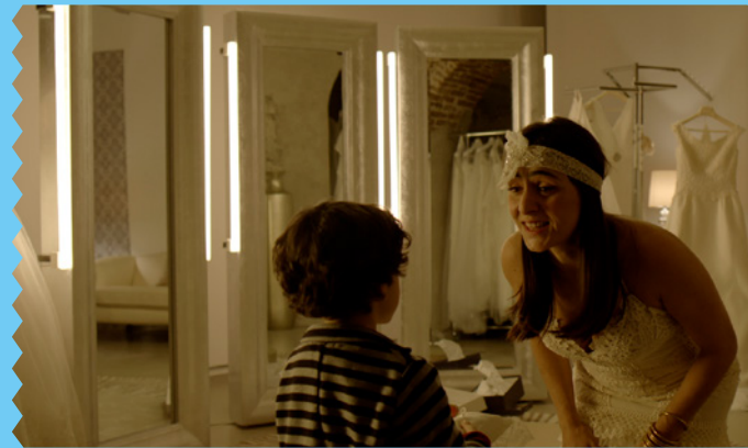
LAS OVEJAS NO PIERDEN EL TREN | ÁLVARO FERNÁNDEZ ARMERO, 2015

Última película de la saga de terror REC, de Jaume Balagueró y Paco Plaza. Para su protagonista, Manuela Velasco, el pesquero ruso del puerto de La Luz donde se filmó es uno de los personajes más siniestros de las cuatro entregas.