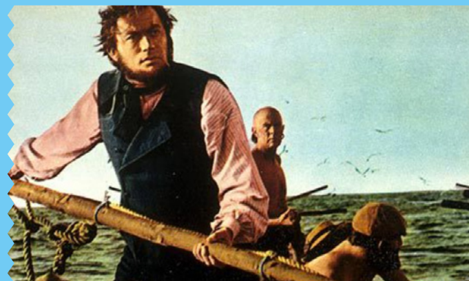
MOBY DICK | JOHN HUSTON, 1956

Hollywood adaptó el clásico de la literatura de Hermann Melville, con guión de Ray Bradbury y John Huston y protagonizada por Gregory Peck como el Capitán Ahab. Fue la película más taquillera en EEUU. Considerada de las mejores cien películas de la historia del cine.