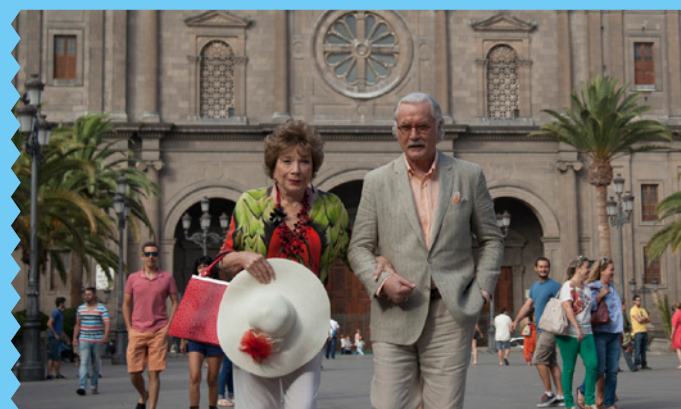
COMO REINAS | ANDY TENNANT, 2016