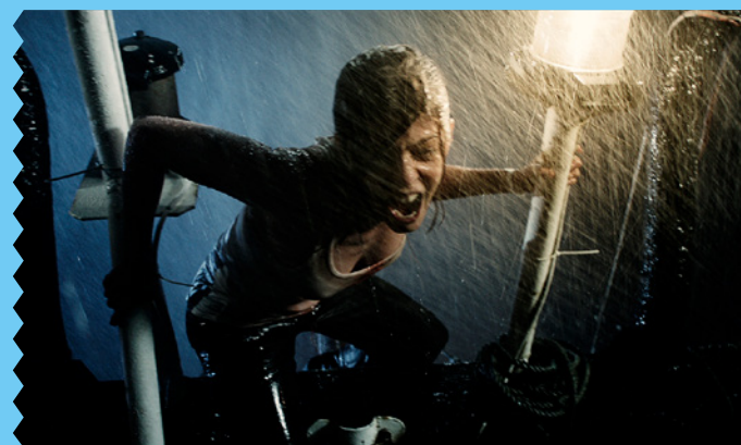
REC 4: APOCALIPSIS | JAUME BALAGUERÓ, 2014

Éxito de taquilla nominado a 16 Premios Goya. Un thriller sobre el narcotráfico en el Estrecho de Gibraltar. Protagonizado por Luis Tosar, Eduard Fernández y Bárbara Lennie, dio a conocer al actor Jesús Castro.