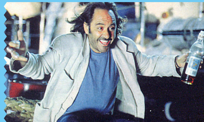
COMO UN RELÁMPAGO | MIGUEL HERMOSO, 1996

Película sobre un abogado madrileño que viaja a Las Palmas para reencontrarse con la mujer de la que está enamorado, una cubana ex drogadicta y ex delincuente a la que defendió. Seleccionado en la Semana Internacional de la Crítica del festival de Cannes.