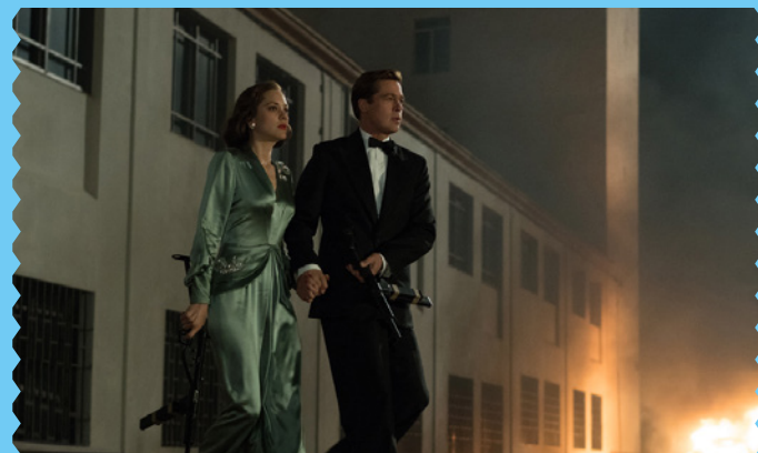
ALIADOS | ROBERT ZEMECKIS, 2016

Thriller sobre un atraco a un banco protagonizado por Raúl Arévalo, José Coronado y Raúl de la Serna. De las películas más taquilleras de 2016. Las Palmas se convirtió en la ciudad española de Valencia.