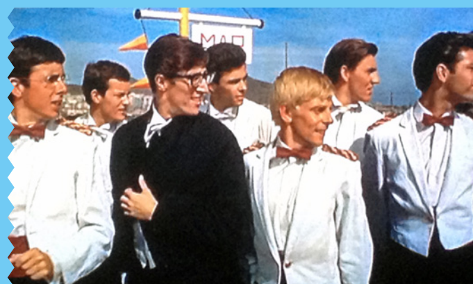
DÍAS MARAVILLOSOS | SIDNEY J. FURIE, 1964

Ambiciosa coproducción hispano italiana protagonizada por Marcelo Mastroianni, Silvana Pampanini y Gustavo Rojo sobre la Conquista de Gran Canaria en el siglo XV. La película que más recursos locales ha movilizado para el rodaje, con numerosas anécdotas.