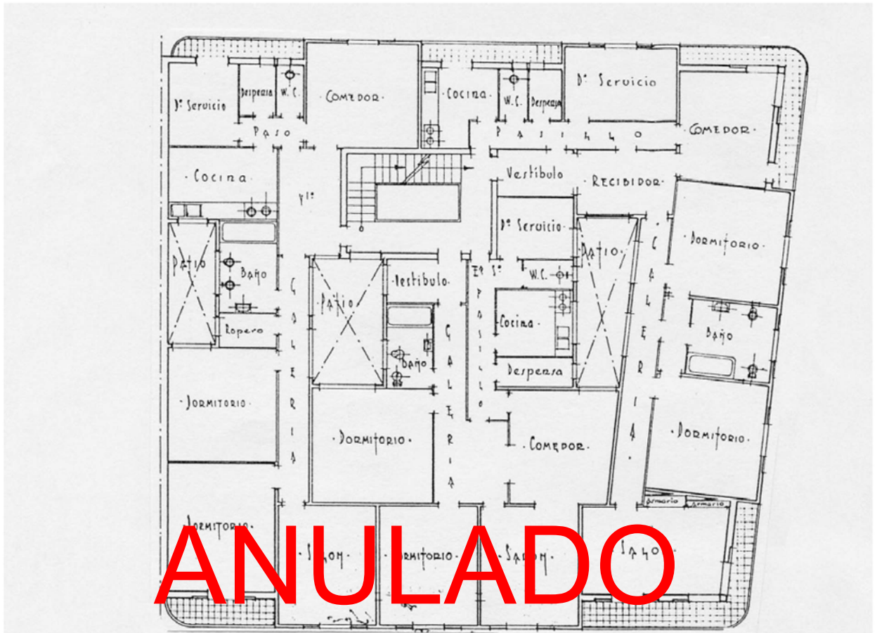
1. Planta de los pisos altos.