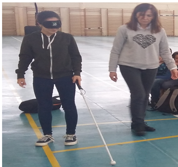
Una de las técnicas de la ONCE simulando un recorrido con bastón y antifaz

Técnicos de la institución informan sobre ésta discapacidad, realizando, además, una actividad vivencial, en la que el alumnado se coloca unos antifaces y realizan un recorrido. Además, en ésta ocasión, vendrán acompañados por los perros de asistencia por lo que el alumnado tendrá la ocasión de conocerlos y saber las tareas que realizan.