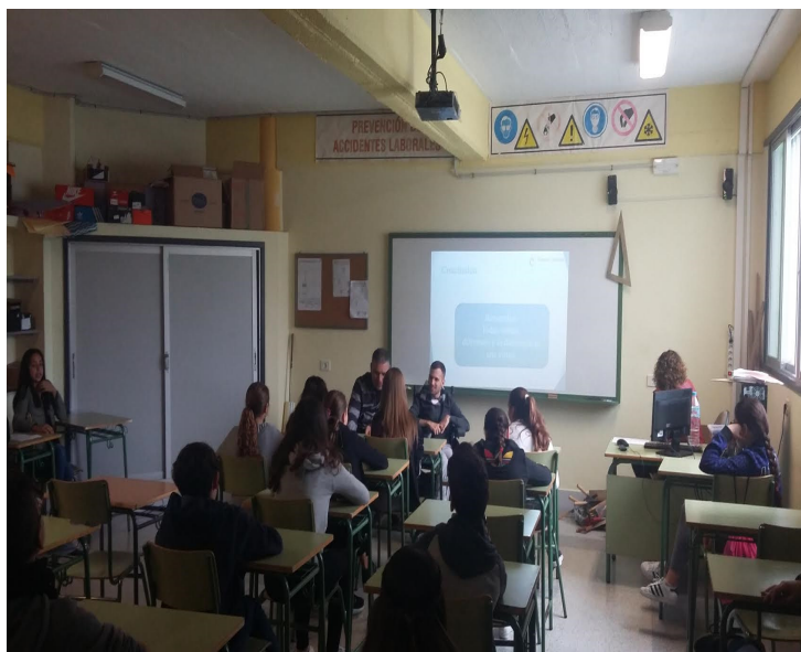
Otra imagen del taller sobre Acoso escolar y Discapacidad.