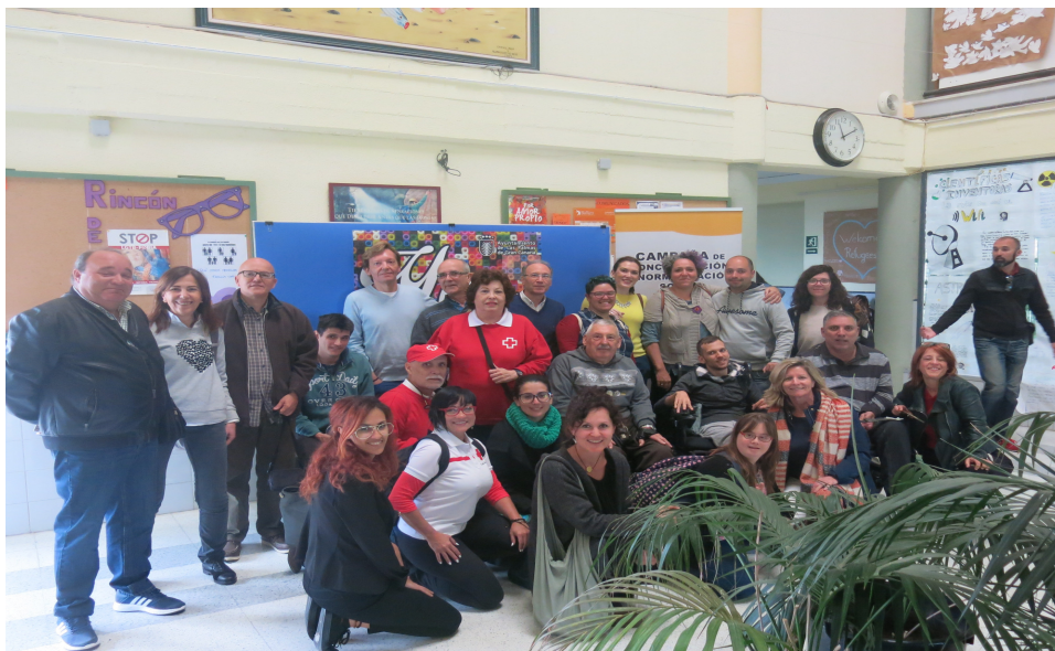
Parte del equipo que lleva a cabo los talleres

Así mismo el centro aseguró que las aulas fueran accesibles y que tuvieran una capacidad para, al menos, 30 personas.