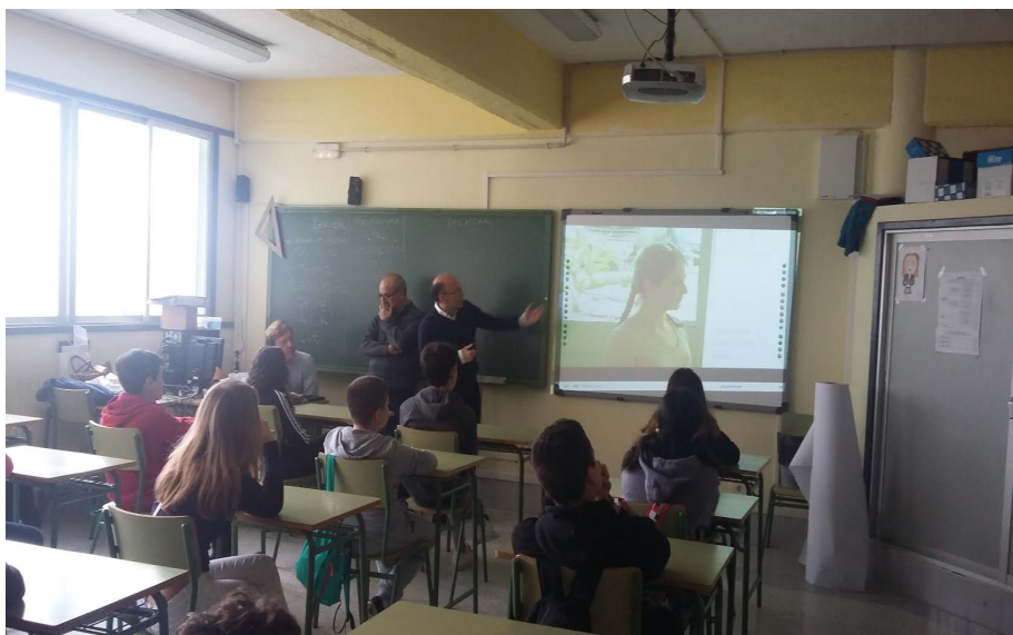
En la imagen los ponentes impartiendo el taller