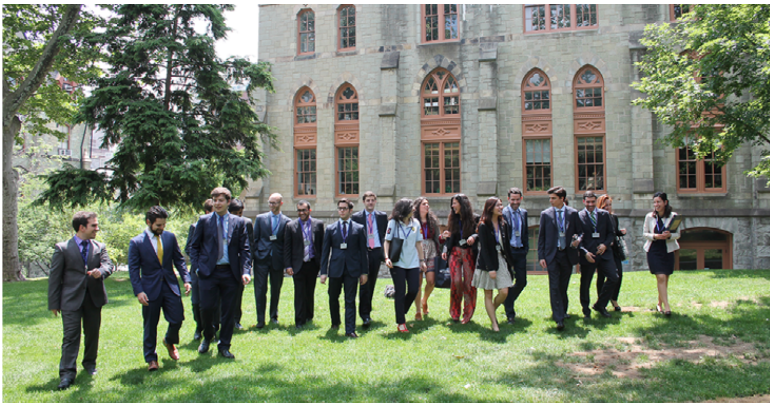
▲ Alumnos de IEB en su estancia internacional en la Universidad de Wharton

Un claustro de profesionales en activo, formación práctica y acuerdos de colaboración con empresas , son la mejor fórmula del IEB para la empleabilidad de los alumnos.