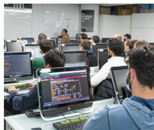
▲ Alumnos de IEB especializándose en la Sala Bloomberg

Las Compañías buscan profesionales con formación, pero sobre todo con preparación práctica y especializada , que puedan aportar valor desde el primer día, como ocurre con el MBA con especialización en Finanzas , los Másteres en Mercados Financieros, Finanzas Internacionales, Finanzas Corporativas, Auditoría, Blockchain , etc, del IEB.