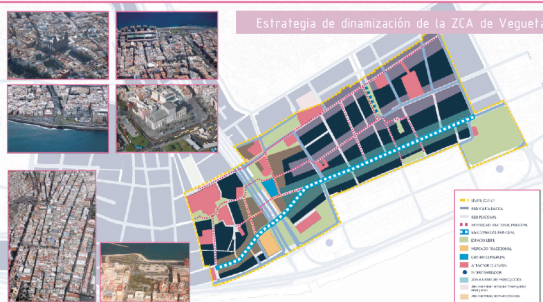
Estrategia de dinamización de la ZCA de Vegueta - Triana