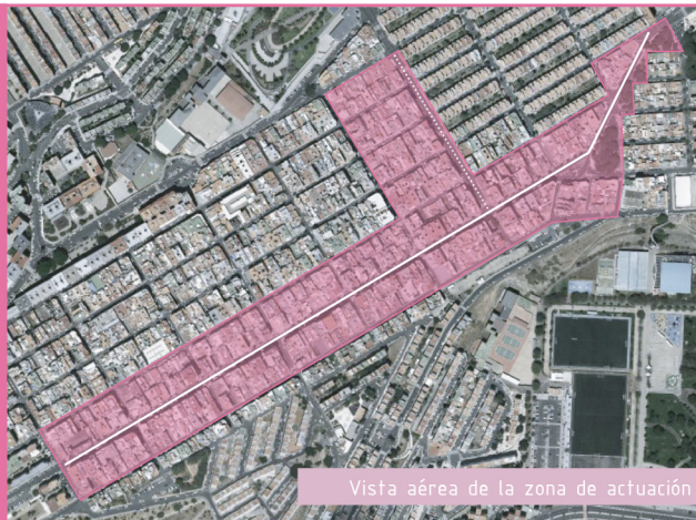
Vista aérea de la zona de actuación