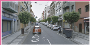
c/ Don Pedro Infinito