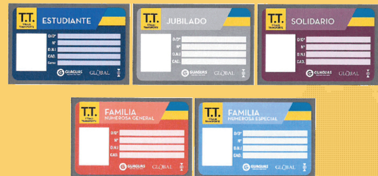
Bonos de transporte adaptado a las necesidades

Es necesario articular políticas de acceso a los servicios públicos para proteger a los colectivos en riesgo: niños, adolescentes, jóvenes y familias. La provisión de servicios públicos y el apoyo a las familias en situación vulnerable en el ámbito del cuidado de sus hijas e hijos resultan centrales para facilitar la conciliación familiar también entre estos grupos, con el objetivo de incrementar de incrementar su renta a través de la participación en el mercado de trabajo y combatir así la pobreza y la desigualdad material.