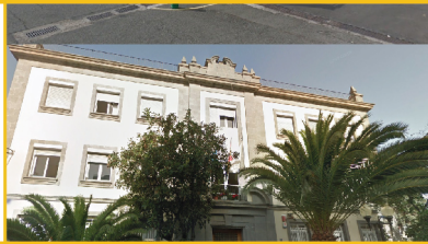
CMSS de Distrito Centro