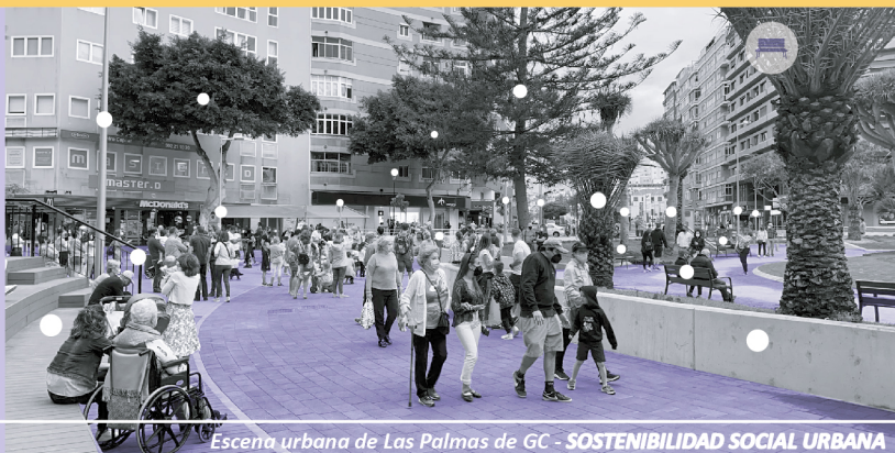
Escena urbana de Las Palmas de GC - SOSTENIBILIDAD SOCIAL URBANA

"El EQUILIBRIO URBANO se fundamenta en la SOSTENIBILIDAD SOCIAL URBANA"